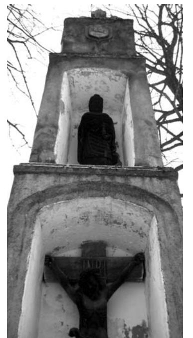
Nepriklausomybės dešimtmečio koplytstulpis, pastatytas 1928 metais Rimkų sodyboje, yra pirmasis tarpukario monumentas laisvei dabartinio Anykščių rajono teritorijoje.