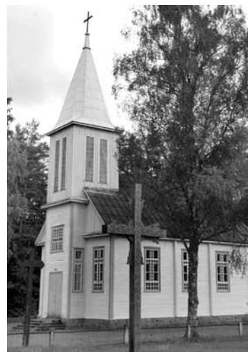
Inkūnų parapiją iki šiol aptarnavo Andrioniškio parapijos klebonai.