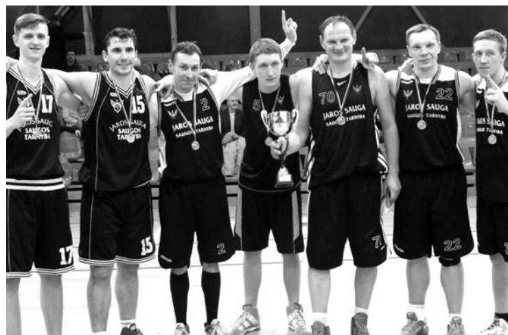
Anykščių rajono krepšinių pirmenybių nugalėtojai - „Jaros saugos“ krepšininkai.

„Kūno kultūros ir sporto centras“ varžybų pertraukėlių metu buvo parengę įvairiausių užduočių žiūrovams, kurių metu buvo galima laimėti prizus.