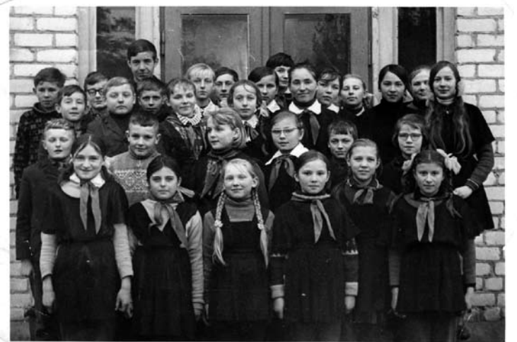
Iš plačios apylinkės susirinkę vardan mokslo šviesos - grupė Žaliosios aštuonmetės mokyklos mokinių apie 1973 metus.